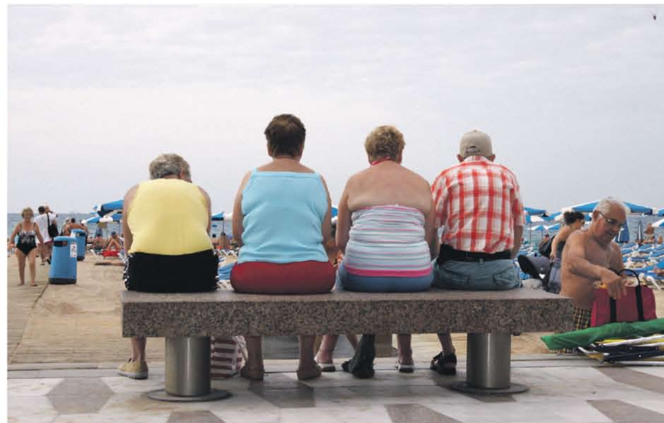
Pensionado's op een bankje op de boulevard van Benidorm.

Daarmee ligt de weg open voor contracten met ziekenhuizen in andere Europese regio's zoals de Algarve in Portugal of de Spaanse kuststrook rond Barcelona. Verzekeraars noemen ook Turkije en Marokko als optie, mits de klinieken aan alle kwaliteitseisen kunnen voldoen. 'Eigenlijk kan ik overal in het Neder-